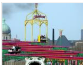
(Hamburger DOM / Hoch Zwei)