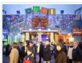
Illusion und Realität

Prillblumen, knallig bunte Farben und Party-Hits aus den 60er und 70er Jahren – das ist das Laufgeschäft Psychodelic. Hier könne sich die Besucher auf dem Hamburger DOM in die Zeit der Hippies zurückversetzen lassen. Hinter der schillernden Fassade wartet ein psychedelisches Labyrinth mit verschiedenen Showräumen und farbdurchfluteten Gängen: Eine spaßige Zeitreise mit modernsten Lichteffekten und fluoreszierenden Objekten ins Reich des Regenbogens. Die an der Kasse ausgegebene Multispektralbrille zum Mitnehmen lässt den Parcours zu einem Flower-Power-Erlebnis der besonderen Art werden.