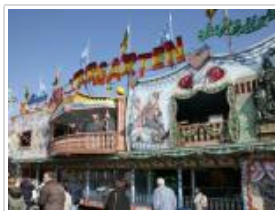
Der große Glasirrgarten - Absoluter DOM-Klassiker (Hoch Zwei)

Die Simulationsanlage lockt mit Illusionen und Wahrnehmungstäuschungen. Nur im Selbstversuch können die Besucher herausfinden, in wie weit sie ihren eigenen Augen trauen können. Das Laufgeschäft ist ein Rätsel zwischen Illusionen und Realität. Omni bietet einen unterhaltsamen und informativen Rundgang durch die Wunderwelt der Physik.