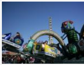
(Hamburger Dom / Hoch Zwei)