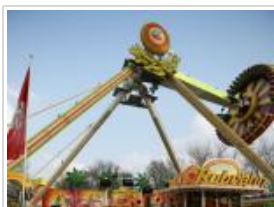
(Hamburger Dom / Hoch Zwei)

Der Musikexpress ist ein rasantes Rundfahrgeschäft mit langer Tradition. Durch die Fliehkraft des kleinen Radius' werden die Fahrgäste mit einem hohen Flirtfaktor nach außen gedrückt. Und besonders kuschelig wird es, wenn die Raupe unter einem Stofftunnel verschwindet.