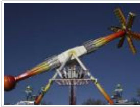
(Hamburger DOM / Hoch Zwei)