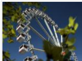
Riesenrad - Das größte transportable Riesenrad der Welt (Hoch Zwei)

Der DOM-Dancer ist ein Rundfahrgeschäft mit 16 Gondeln, die sich auf einer Plattform und die verschiedensten Achsen drehen. Der Fahrgast sollte möglichst schwindelfrei sein, denn hier geht es richtig rund. Auch bei der Gestaltung hat man sich viel Mühe gegeben und viele "Hamburgensien" einfließen lassen. So sind die Gondeln zu verschiedensten Hamburger Themen aufwendig bemalt, und so gibt es natürlich eine DOM Gondel, aber z.B. auch eine Gondel für HSV Fans und eine für die St. Pauli Fans. Die aufwendige LED-Light und Nebel- Show vervollständigen den garantierten Fahrspaß.